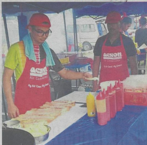
Caps, aprons and a neat stall are a must for traders at Ramadan bazaars.

well as the Sepang District Health Office will conduct inspections throughout the month," he said.