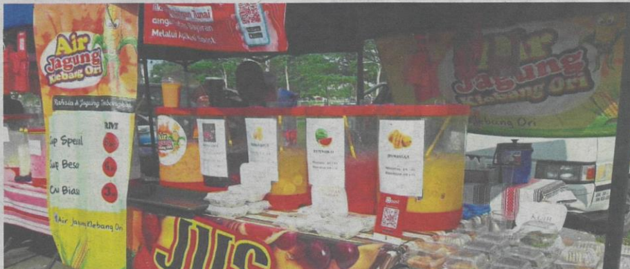
Prices stated clearly on a big banner at a bazaar stall.

"Officers from MPSepang's Licensing, Environmental Health