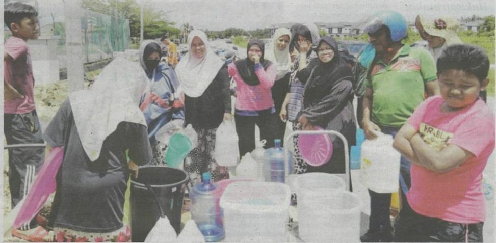
Penduduk terpaksa menadah air yang disalurkan dari tangki simpanan air di kawasan taman perumahan berhampiran.

kegunaan seperti memasak dan yang lebih penting. Kami juga terpaksa catu air untuk mandi. “Lebih rumit, sekarang bulan puasa. Kami terpaksa makan ala kadar untuk terbuka dan bersahur sebab air dicatu,” katanya.