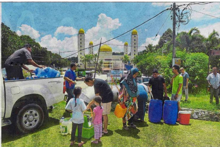
People queuing up to get water at Masjid Jamek Ar Rahimiah in Klang yesterday.