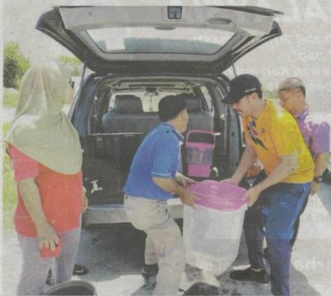
Penduduk terpaksa berulang alik untuk mendapatkan bekalan air.

Menurutnya, dia berharap gangguan bekalan air di kawasan terlibat segera diatasi.