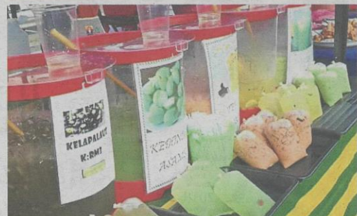
Example of imaginative product display at a Ramadan bazaar stall selling